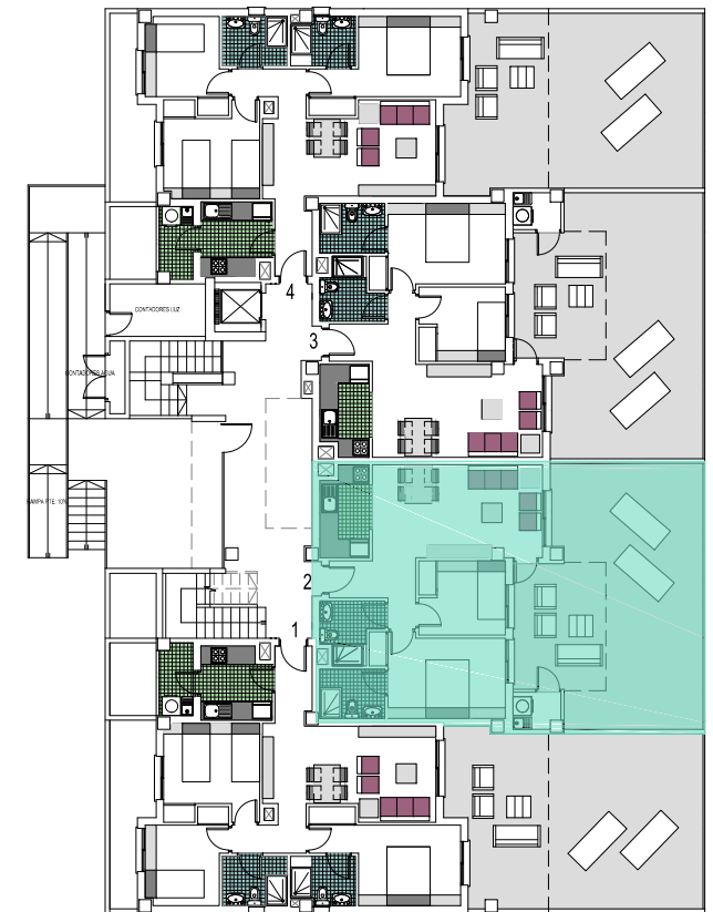
(PLANTA BAJA )